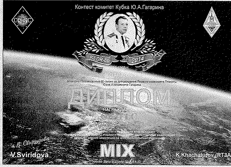
Diplom z programu KEDR.

na propagaci olympiády a paralympiády mezi radioamatéry na celém světě. Obdrželi licence a speciální značky od 1. ledna do 31. března 2014. Jednalo se zhruba o 200 stanic rozmístěných po celém území Ruska, 19 stanic přímo z olympijského dění v Soči. Nastavily soutěžní podmínky, udělali propagaci (www.ok2014.ru) a ten, kdo je splnil, mohl si zažádat o udělení diplomu. Působím v radioamatérském sportu už hodně dlouho, ale lepší aktivitu, organizovanost a kázeň provozu jsem ještě nezažil,“ chválí ruské radioamatéry Michal. Podle jeho slov provedli během obou olympiád přes 2 500 000 spojení s celým světem. Byly stanice, které měly 80–90 000